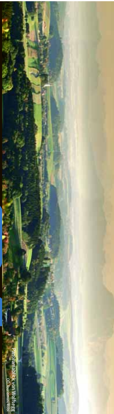
Panoramablick von Wolfsegg